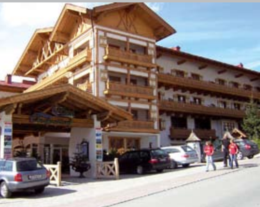
Der schöne Ort des Geschehens - das Sport- und Wellnesshotel Oberforsthof