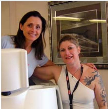
Die beiden Sängerinnen und Stars während der HYPOXI-Trainingstage unter sich...