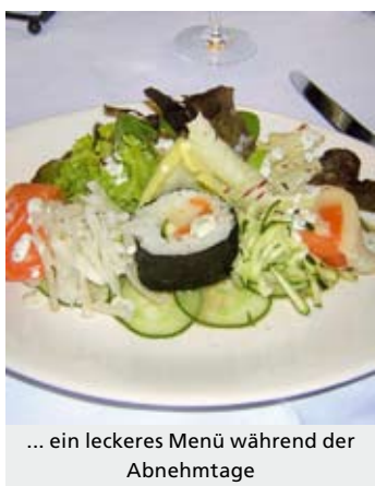
... ein leckeres Menü während der Abnehmstage

Info: www.hypoxi.com www.oberforsthof.at ◆