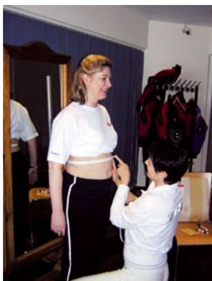
Das Messen des Umfangs von Bauch, Hüfte, Beine und po vor der HYPOXI -Therapie