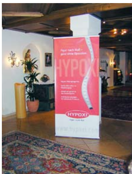
So sah der Empfang von HYPOXI im Oberforstthof in A-St.Johann/Alpendorf aus

Schon vor der Abreise werde ich gezielt gefragt, an welchen Stellen ich meine Figur verbessern möchte, damit das Team von HYPOXI vorab einplanen kann, an welchen Geräten ich trainieren werde. Ich bin gespannt! Sogar Sportbekleidung wird mir täglich zur Verfügung gestellt, was ich als höchst angenehm empfinde, erspart es doch viel Zeit beim lästigen Koffer packen. Nur die Sportschuhe durften nicht vergessen werden. Und am 3.4.06 geht’s los. Ich komme in einem wunderschönen Hotel in den Bergen in einem attraktiven Skigebiet an und bin erstaunt von dem Ambiente und dem genialen Landschaftsbild wie im Bilderbuch. (Am liebsten würde ich erst einmal den Berg hinauflaufen und meine Rockröhre in die Unendlichkeit schmetter lassen, was ich allerdings am nächsten Tag während einer Pause auch gleich mal gemacht habe.) Gleich nach dem sympathischen Einführungs-gespräch merkte ich sehr schnell, was